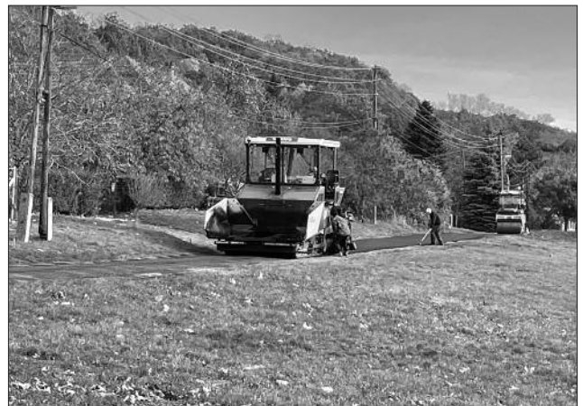
A Csókakő utca felújítása a sportpálya megközelítése és ott zajló rendezvények miatt is időszerű volt.

Hasonló helyzet alakult ki a Csókakő utcában is, ahol az utca szőlőhegy felőli, felső részét burkoltuk le egy vágás úttal, de az alsó részre nem volt pályázati forrás. Az önkormányzat ezt is saját